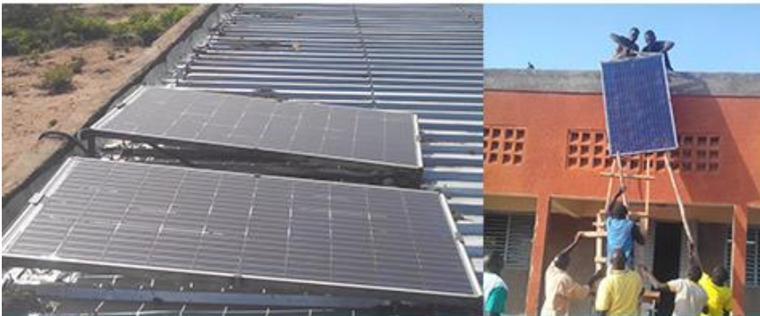
AD'Rfaso - Association pour le développement rural