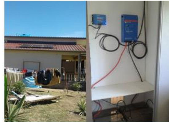
Ma maison autonome