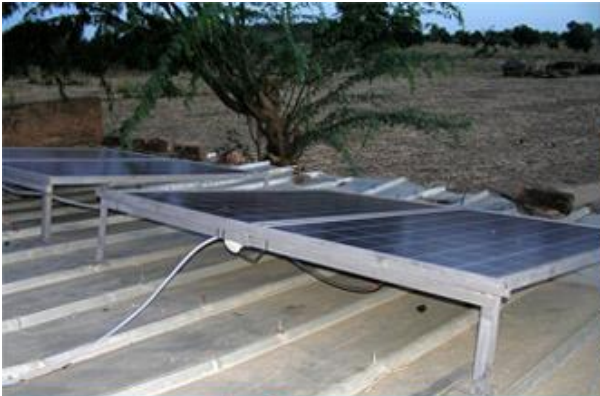
Accès à l'eau potable en Afrique – Un pont pour un puit