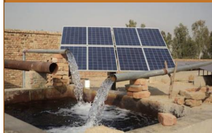
Kit solaire pompage