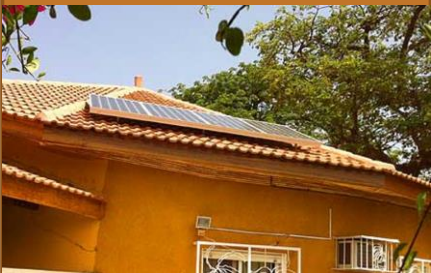
Kit solaire hybride