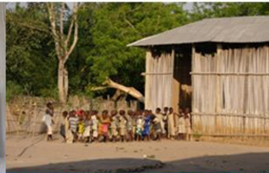
Projet Agonvé au Bénin d'Electricien Sans Frontières