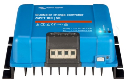
Contrôleur de charge solaire MPPT 100/50