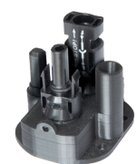
Passe-pont/passe-cloison résistant aux UV avec connecteurs rapides solaires Ref 1481

*Suivant conditions de test standardisées (STC) : ensoleillement de 1000 W/m 2 , AM 1.5, température des cellules 25°C ** Nominal operating cell temperature / température d'utilisation des cellules : ensoleillement de 800 W/m 2 , avec une température ambiante de 25°C et un vent de 1m/s.