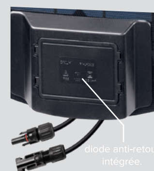
diode anti-retour intégrée.