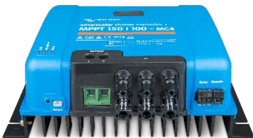
Contrôleur de charge SmartSolar MPPT 150/100 MC4 sans écran